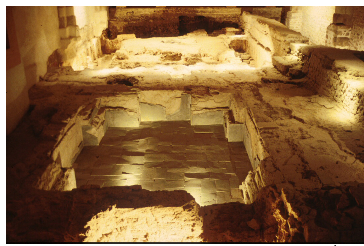
Thermes romains, sous l'Église