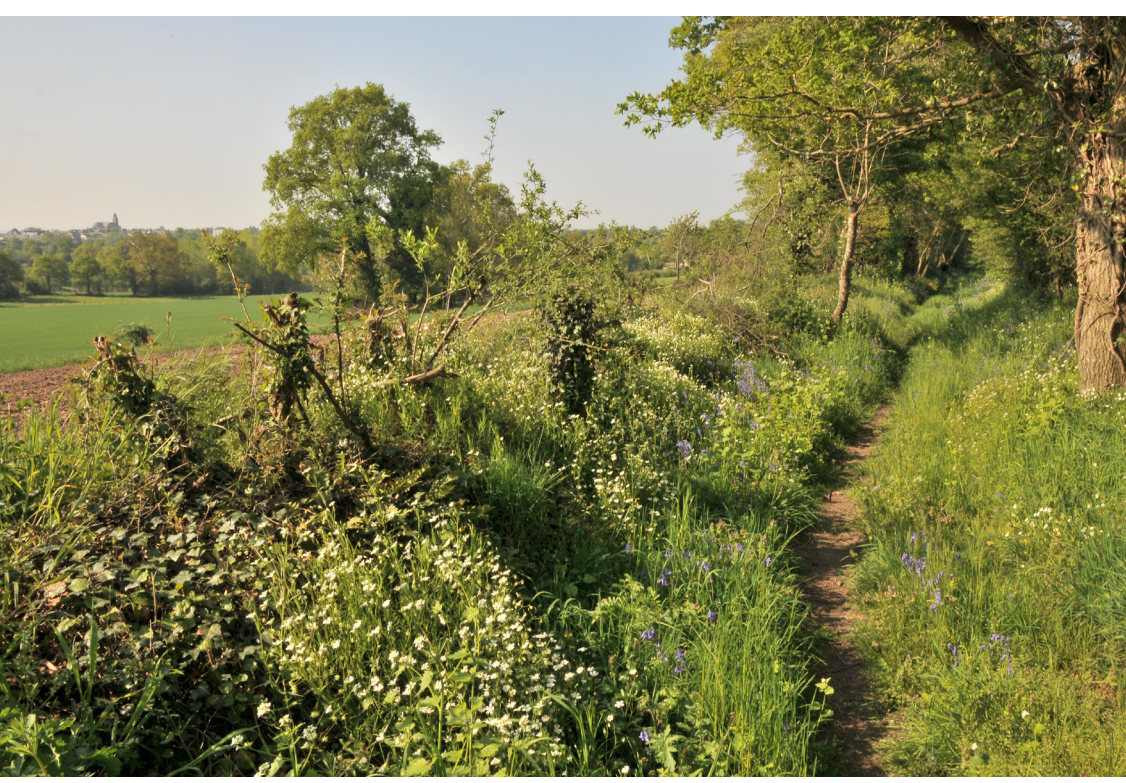
Chemin le long de l'aqueduc romain