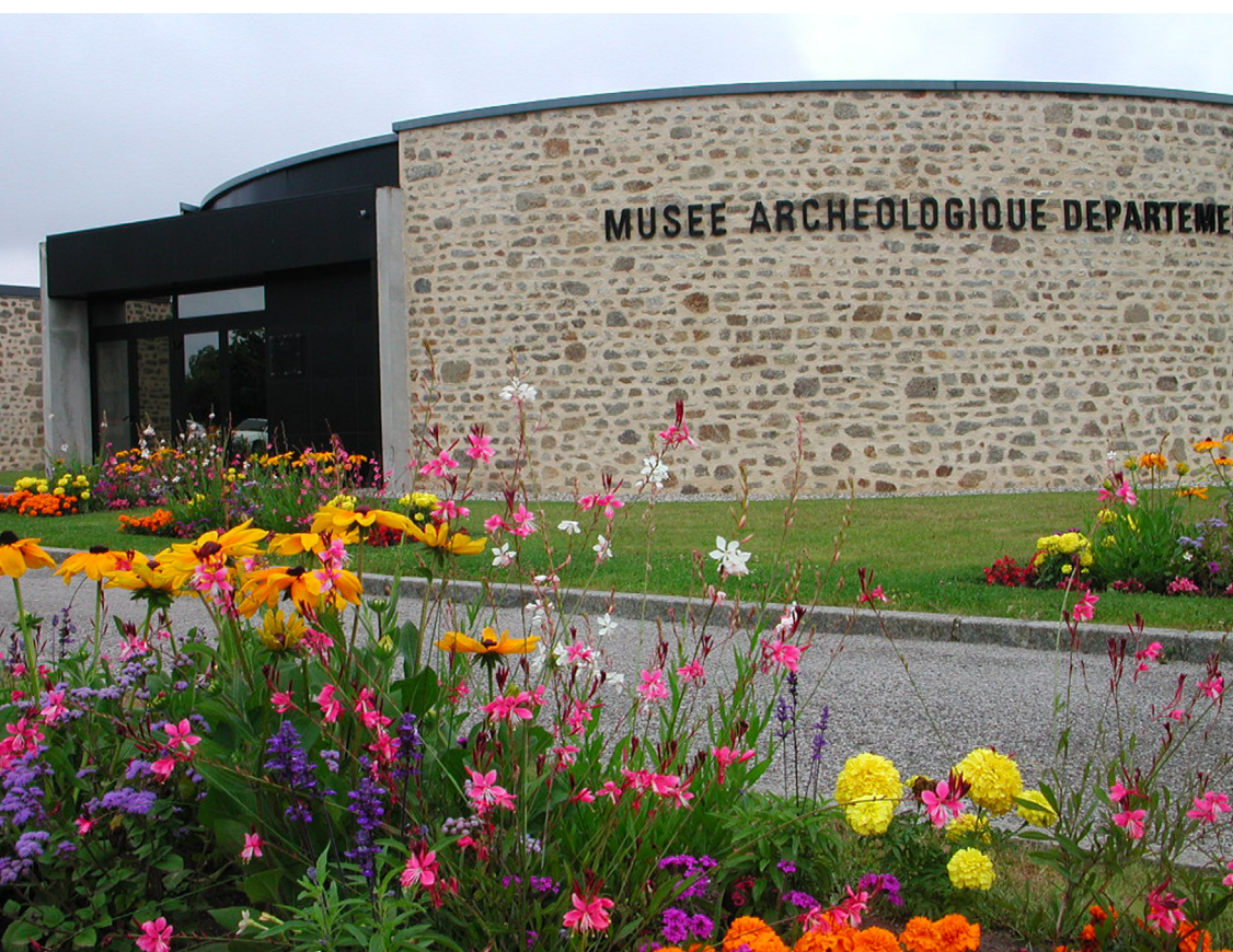
Musée archéologique départemental