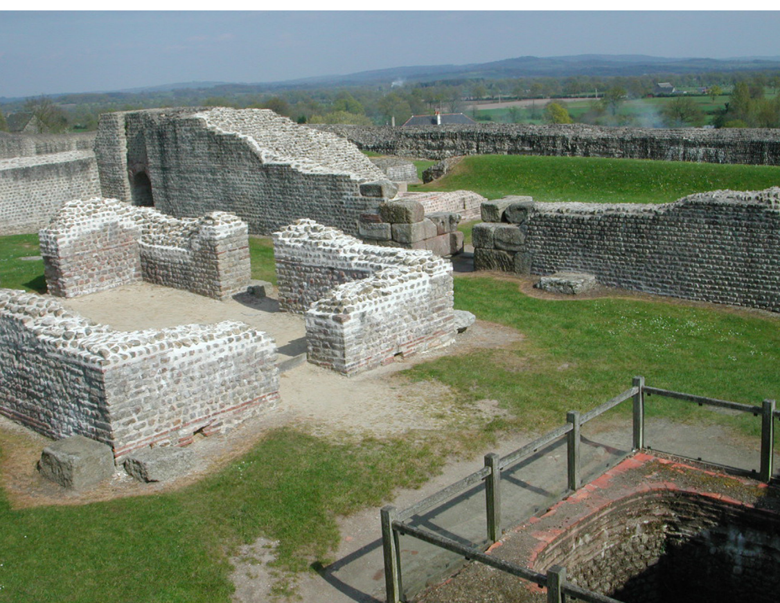
Intérieur de la Forteresse