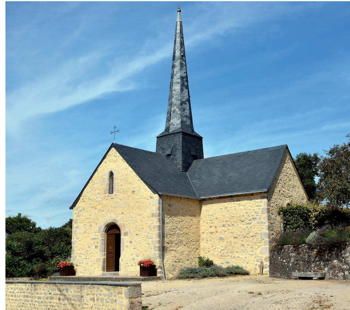
Chapelle de Doucé